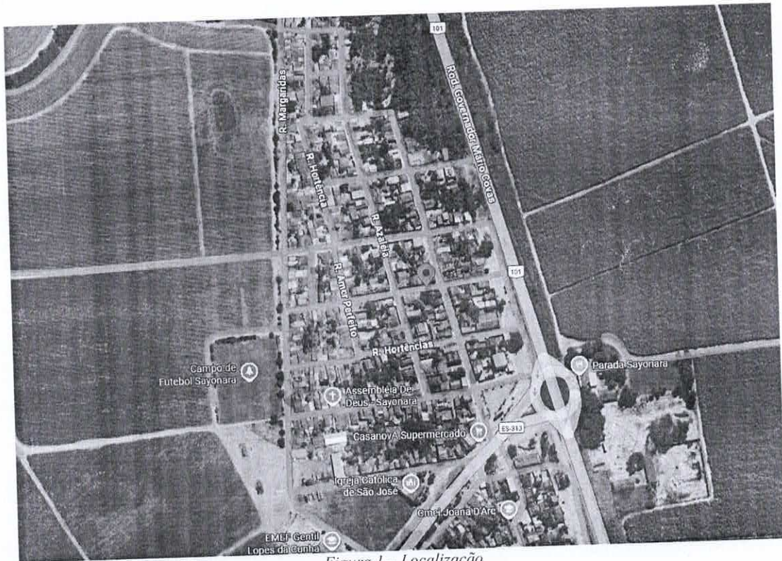
Figura 1 - Localização