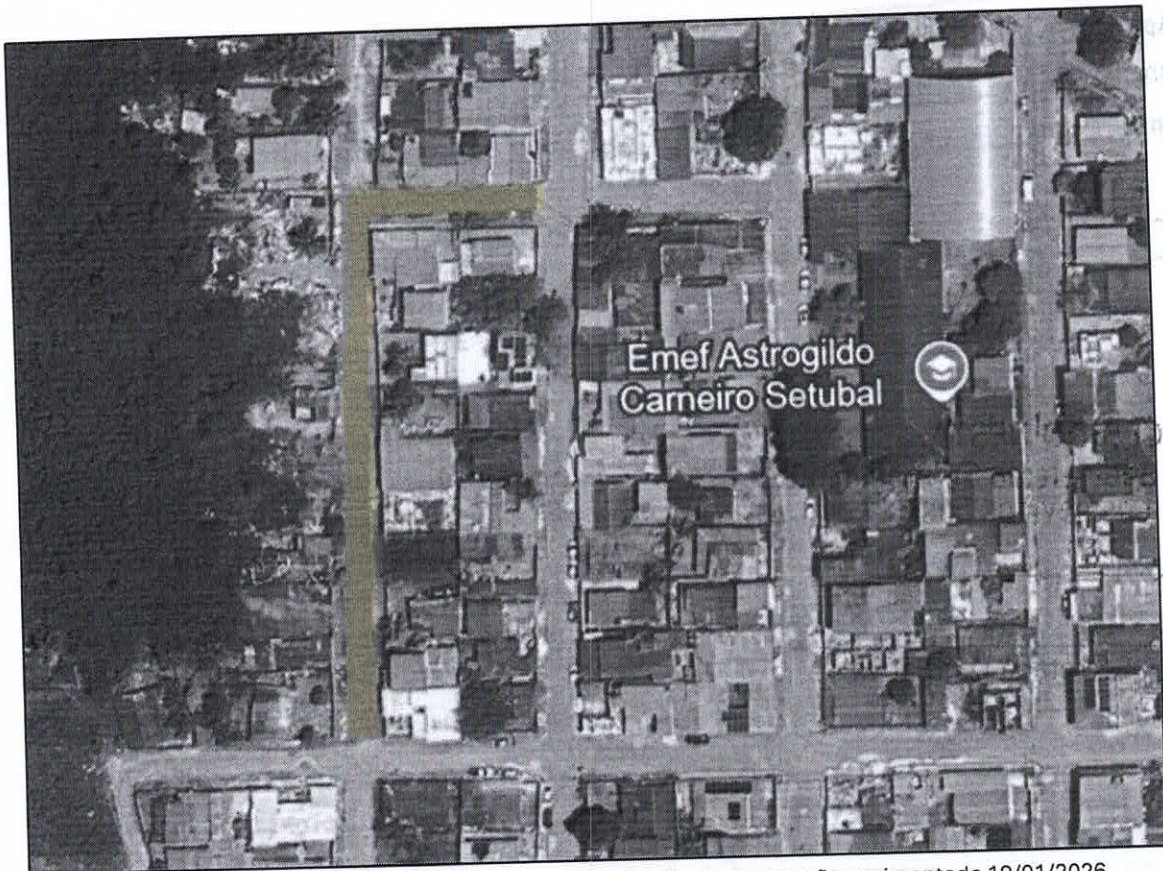
Imagem via satélite, trecho da rua mangabeira, bairro Santo Amaro não pavimentado 19/01/2026

Conceição da Barra – ES, 19 de janeiro de 2026