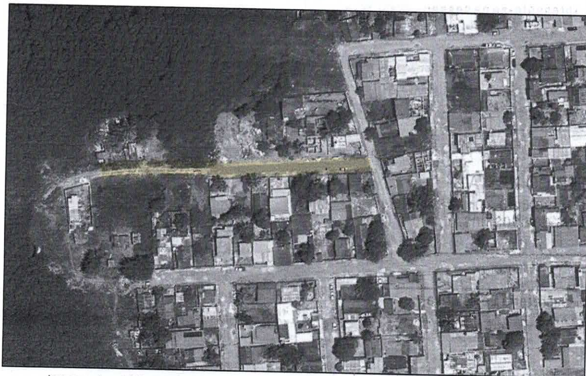
Imagem via satélite, trecho da rua laranjeira, bairro Santo Amaro não pavimentado 19/01/2026

Conceição da Barra – ES, 19 de janeiro de 2026